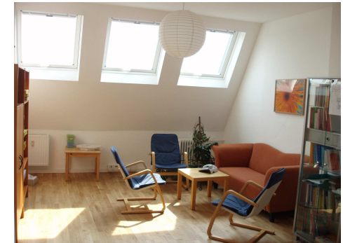
Besprechungen in familiärem Ambiente