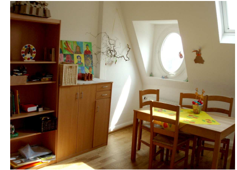
Möglichkeit zum Spielen, Lernen und Kreativ-sein